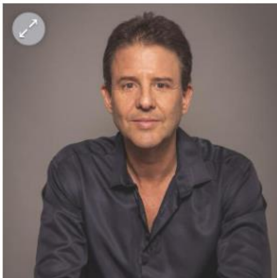
יגאל צמח

עליית אוכלוסייה מבוססת לישראל אף צפויה להעתיק עימה גם הון פרטי ניכר, שיכול לתפקד כמנוע כלכלי חזק, במגוון תחומים, בין השאר, השקעות בטכנולוגיה, בהינתן שרבים מהעולים בעלי רקע בטכנולוגיה ויכולים לעבות את שכבת עובדי תעשיית הייטק, ולתפוס משבצות של רבים מעובדי הענף שהעתיקו מגוריהם לחו"ל; תמיכה בנדל"ן ובפיתוח אזורי – נהירה של עולים מארה"ב תיצור ביקוש מוגבר לנכסים למגורים, מסחר ומשרדים, מה שיכול לתמרץ את הפיתוח האורבני. כך, אזורים שונים ברחבי המדינה ייהנו מפריחה כלכלית והתחדשות.